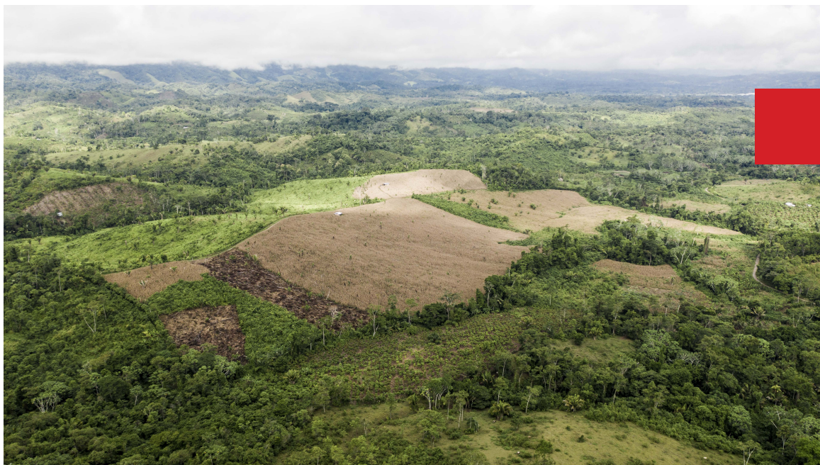
El INGEI 2000 - 2019 señala que la deforestación es la actividad que más contribuye al cambio climático en el Perú.

Para la elaboración del INGEI 2019 se consideraron los lineamientos dispuestos en la Ley Marco sobre Cambio Climático y el INFOCARBONO. En ese contexto, el INGEI 2019 es el resultado de la implementación de las disposiciones del INFOCARBONO, el cual forma parte del Sistema para el Monitoreo de las Medidas de adaptación y mitigación (SIMOM), que representa el Marco de Transparencia Reforzado en respuesta a lo dispuesto en el Acuerdo de París.